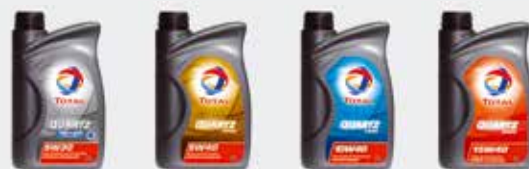
Peugeot рекомендует масла и смазки TOTAL, специально разработанные для двигателей марки.

Следует выбирать только то масло, которое соответствует специальным нормам Peugeot. Таким образом обеспечивается более высокий КПД, увеличивается срок эксплуатации двигателя и сажевого фильтра, а также повышается топливная экономичность.